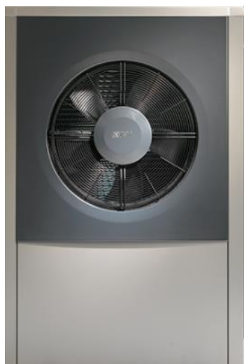
Standardní IVT AIR X